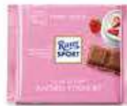
Chocolate Fresa Yogurt CONTENIDO: 100gr UND. X CAJA: 12 |||4000417237002|||