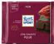
Chocolate Negro CONTENIDO: 100gr UND. X CAJA: 12 |||4000417020000|||