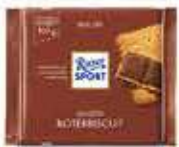
Chocolate c/Galleta Bañada CONTENIDO: 100gr UND. X CAJA: 11 |||4000417214003|||