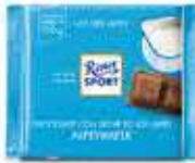
Chocolate c/ Leche CONTENIDO: 100gr UND. X CAJA: 12 |||4000417018007|||