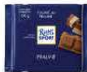
Chocolate c/ Praliné CONTENIDO: 100gr UND. X CAJA: 13 |||4000417026002|||