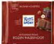
Chocolate c Leche Avellanas & Pasas CONTENIDO: 100gr UND. X CAJA: 12 |||4000417022004|||