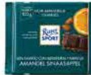
Chocolate Semi Amargo con Almendras y Naranja CONTENIDO: 100gr UND. X CAJA: 12 |||4000417212009|||