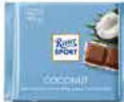
Chocolate c/Coco CONTENIDO: 100gr UND. X CAJA: 12 |||4000417298003|||