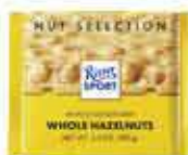
Chocolate Premium Blanco con Avellanas Enteras CONTENIDO: 100gr UND. X CAJA: 10 |||4000417701008|||