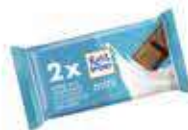
Mini 2pack Chocolate con leche CONTENIDO: 33,34g UND. X CAJA: 21 ||| 42046219 |||