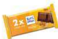
Mini 2pack Chocolate premium con cornflakes CONTENIDO: 33,34g UND. X CAJA: 21 ||| 42046202 |||