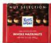
Chocolate Premium Negro con Avellanas Enteras CONTENIDO: 100gr UND. X CAJA: 10 |||4000417702005|||