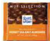
Chocolate Premium con Almendra, Miel y Sal CONTENIDO: 100gr UND. X CAJA: 11 |||4000417704009|||