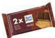
Mini 2pack Chocolate con galleta bañada CONTENIDO: 33,34g UND. X CAJA: 21 ||| 42046165 |||