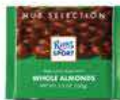
Chocolate Premium con Leche Almendras Enteras CONTENIDO: 100gr UND. X CAJA: 11 |||4000417703002|||