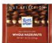
Chocolate Premium con Leche y Avellanas Enteras CONTENIDO: 100gr UND. X CAJA: 10 |||4000417700001|||