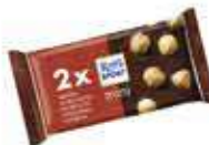
Mini 2pack Chocolate premium con leche avellanas enteras CONTENIDO: 33,34g UND. X CAJA: 21 ||| 42046141 |||